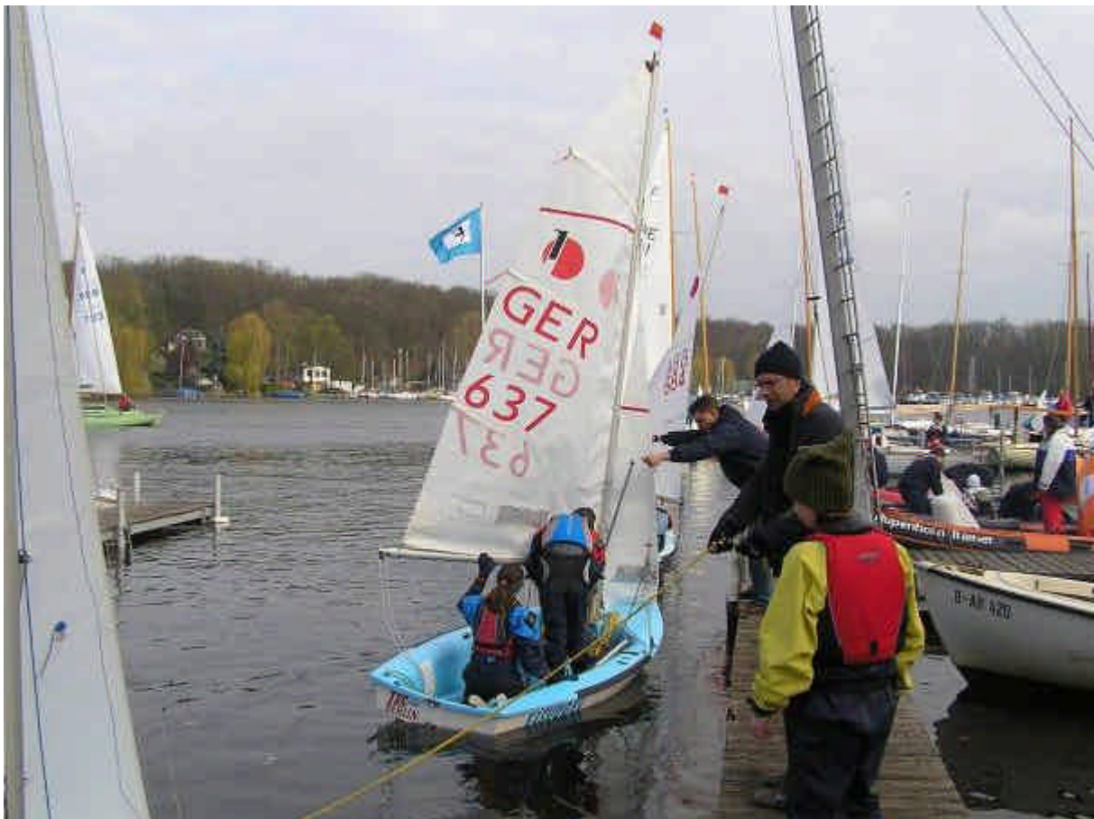
Abfahrt zur Regatta.