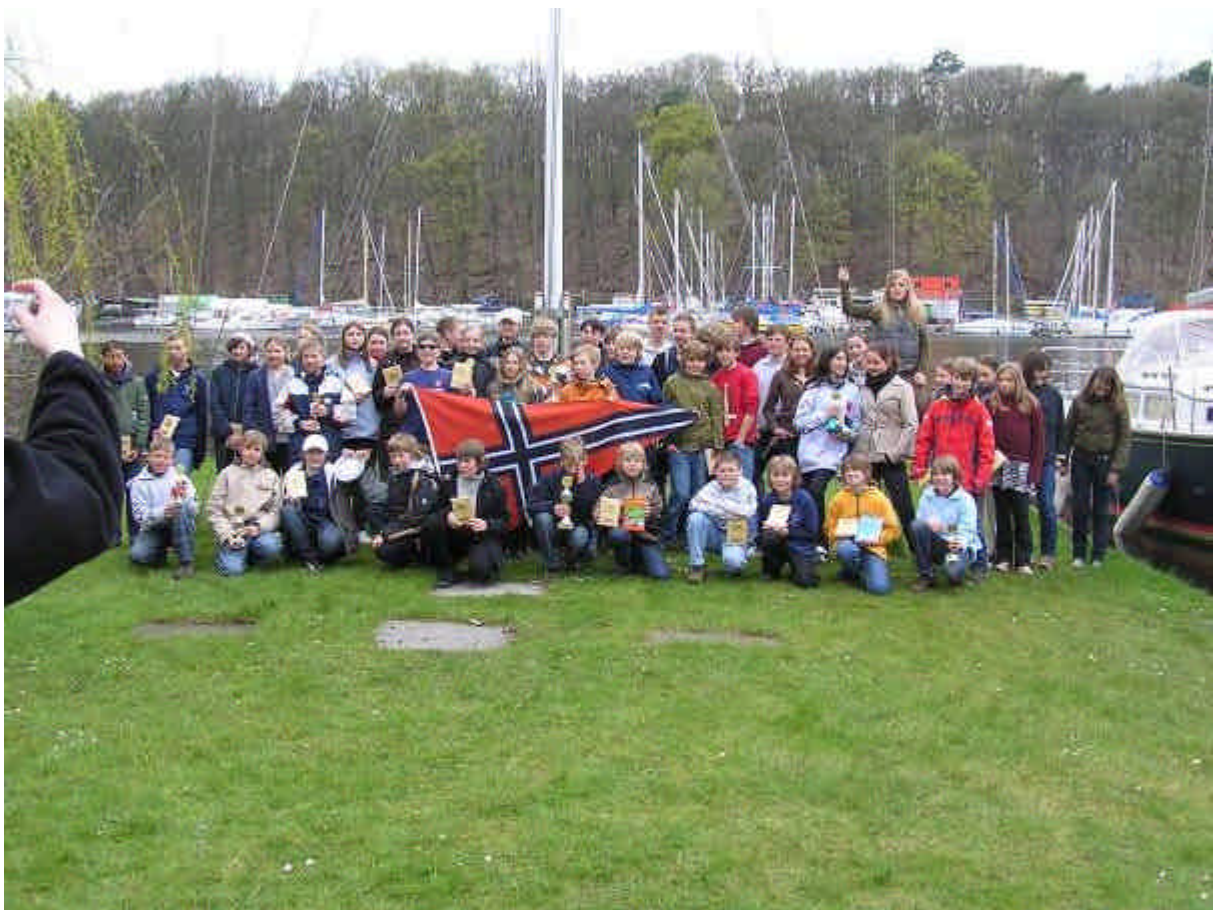
Die T eilnehmer.