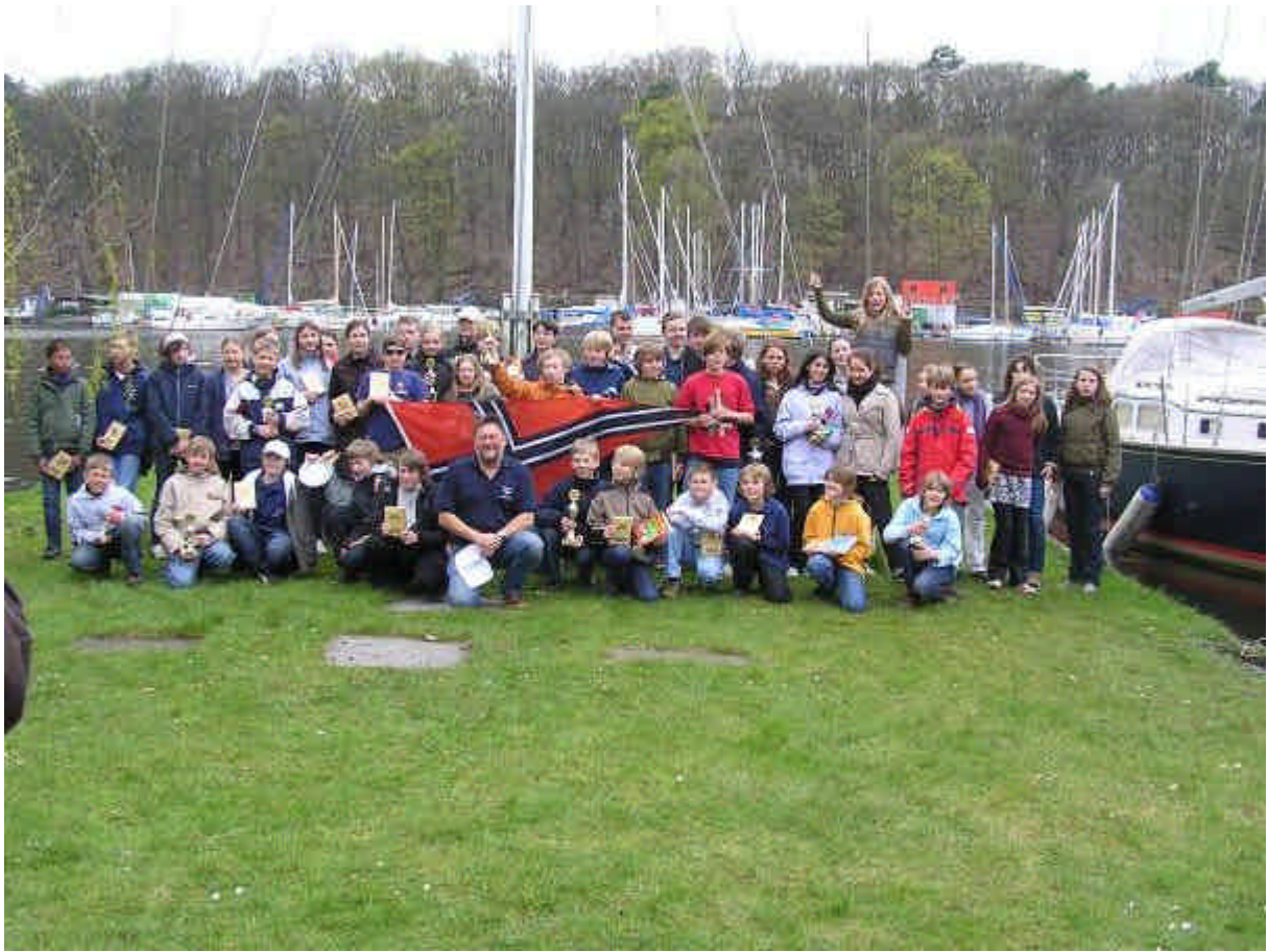
Die Teilnehmer und der "Macher".