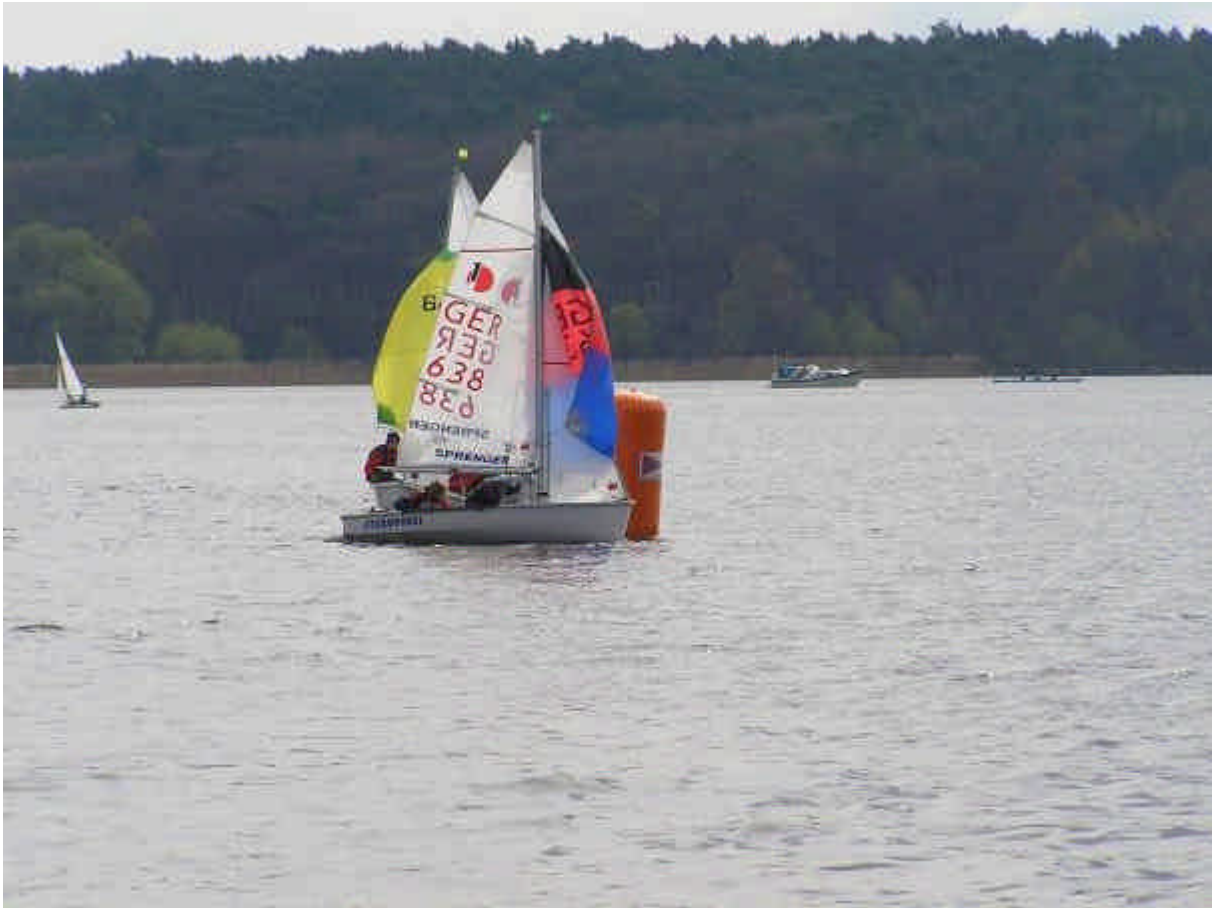
Rundung der Tonne, Anne und Pia Esterl (Boat 638)